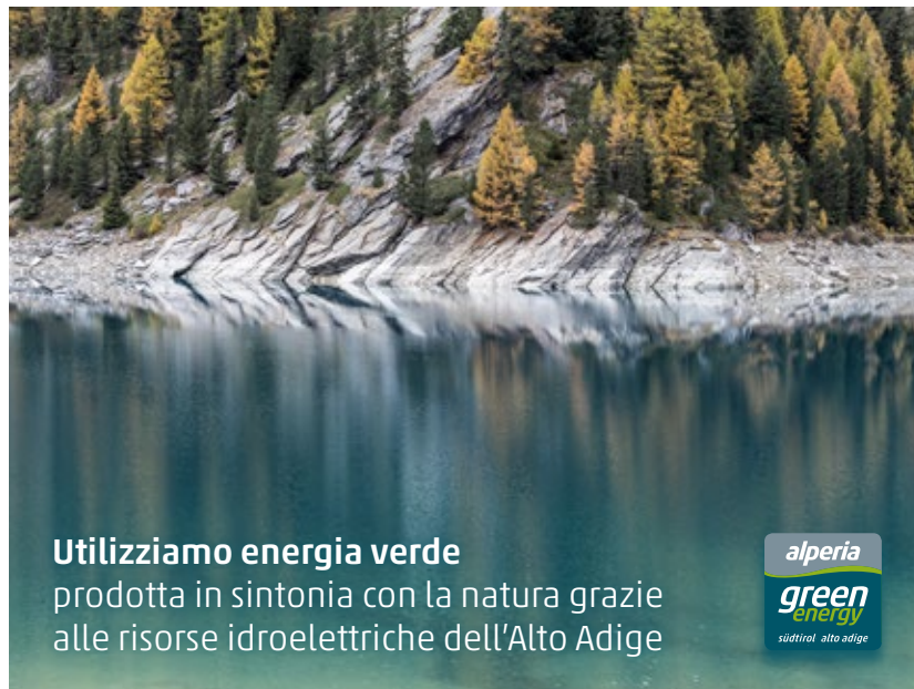
Immagine pubblicitaria messa a disposizione da Alperia

Le immagini arricchiscono la comunicazione. Per questo ti mettiamo a disposizione del materiale fotografico che potrai utilizzare nella comunicazione esterna sui social media o sulla tua pagina web. Ti ricordiamo che il materiale fotografico è coperto da copyright e può essere utilizzato esclusivamente per la comunicazione relativa all'energia verde fornita da Alperia.