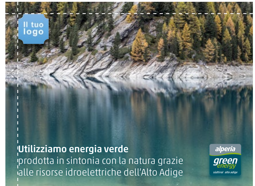
Indicazione per l'eventuale inserimento del tuo logo aziendale